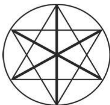
Weltenbaum mit Hag-All-Rune